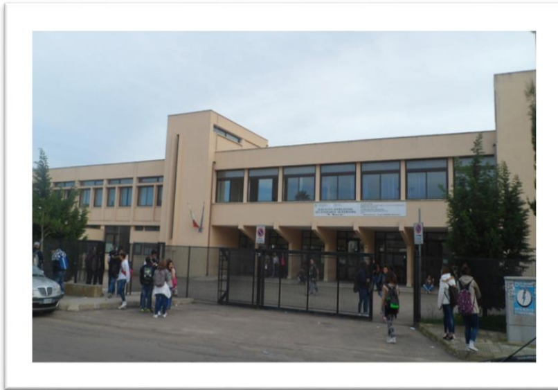
Istituto "N. Moccia" – Sede Centrale di via Bonfante

Presente nella realtà socio-economica e culturale da quasi sessant'anni, l'Istituto "N. Moccia" si articola attualmente in tre diversi indirizzi di studio: "Servizi socio-sanitari", "Servizi per l'enogastronomia e l'ospitalità alberghiera", "Manutenzione e assistenza tecnica".