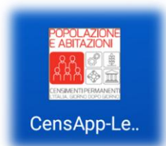
Icona su smartphone